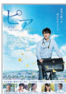
映画「ピア ～まちをつなぐもの」

問合せ 横浜市西区在宅医療相談室 ☎ 620-5830 fax 320-3062