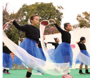
子どもたちによる、手具やバトンを使った創作ダンス。