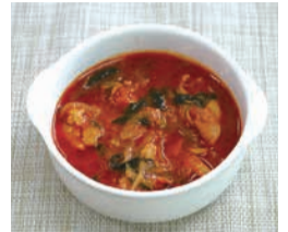
野菜のうまみたっぷり

作り方 1. 野菜と肉を細かく切る。※お好きな切り方でOK 2. 鍋にサラダ油を熱し、おろしにんにく、おろししょうが、玉ねぎを炒める。(3分程度) 3. その他の野菜を入れて中火で炒める。(5分程度) 4. トマト缶と水100ccを入れ煮る。(15分程度) 5. 肉、顆粒コンソメを加え、更に煮る。(30分程度) 6. 塩・コショウで味を調べてできあがり。