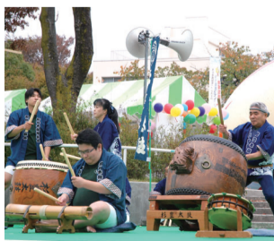
お祭りが始まるワクワクを知らせる、力強い和太鼓の演奏。