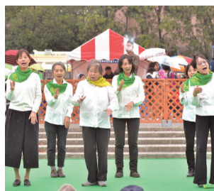
ダンスをするように手話で歌う「手話歌」の披露。