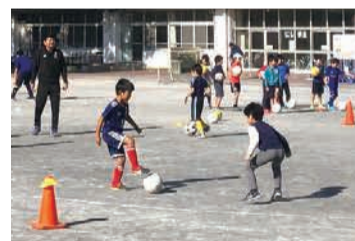
コーチに教わったことを生かしてミニゲームに挑戦

問合せ 西区スポーツ振興事業推進委員会(地域振興課内) ☎320-8390 fax 322-5063